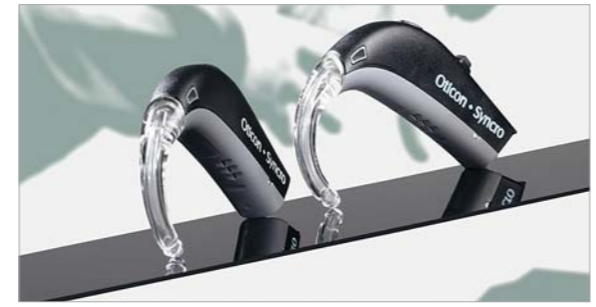
Auch beim Hörgerät ist die Zukunft digital

Die Preise pro Hörsystem liegen zwischen 500 und 1.000 Euro, modernste Spitzentechnik kostet zwischen 1.600 und 2.300 Euro. Einen festgelegten Teil der Kosten übernehmen die gesetzlichen Krankenkassen.